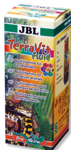
JBL TerraVit fluid Vitaminas y micronutrientes para animales de terrario