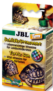
JBL Sol para tortugas Terra Vitaminas para tortugas terrestres