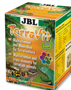
JBL TerraVit polvo Vitaminas y micronutrientes para animales de terrario