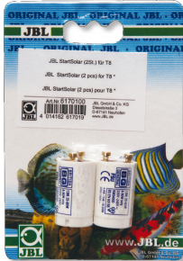
JBL Start Solar Cebador para tubos fluorescentes T8