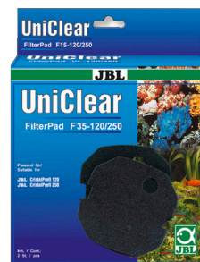
JBL FilterPad F35

Espuma de poro grueso para el filtro CristalProfi