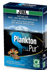
JBL PlanktonPur SMALL Golosinas para peces de acuario pequeños