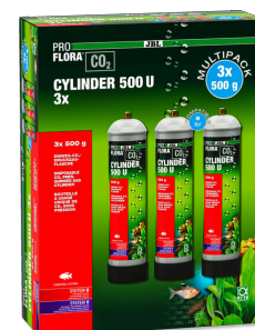
JBL PROFLORA CO2 CYLINDER 500 U 3x

Bouteille à usage unique, remplie de 500 g de CO2