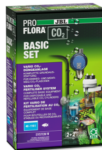
JBL PROFLORA CO2 BASIC SET V CO2-Düngeranlage OHNE FLASCHE für Aquarienflecken