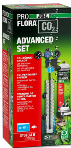
JBL PROFLORA CO2 ADVANCED SET U CO2-Pflanzendüngeranlage-Komplettset + Nachtschaltung