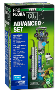
JBL PROFLORA CO2 ADVANCED SET M CO2-Pflanzendüngeranlage-Komplettset + Nachtschaltung