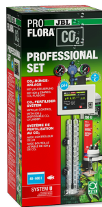
JBL PROFLORA CO2 PROFESSIONAL SET U CO2-Pflanzendüngeranlage-Komplettset + CO2-pH-Steuerung