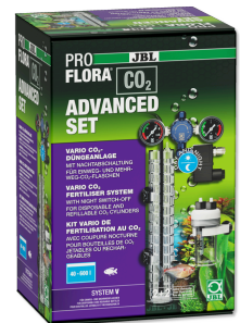
JBL PROFLORA CO2 ADVANCED SET V CO2-Anlage OHNE FLASCHE mit Manometern & Magnetventil