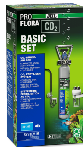
JBL PROFLORA CO2 BASIC SET M CO2-Düngeranlage Basis-Komplettset für Aquarienflecken