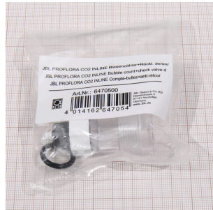
JBL PC CO2 INLINE contabelle+v. non ritorno

Membrana sostitutiva per diffusore CO2 TAIFUN INLINE