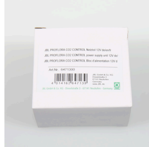
JBL PF CO2 CONTROL Bloc d'alimentation 12 V