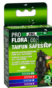
JBL PROFLORA CO2 TAIFUN SAFESTOP Clapet antiretour d'eau pour systèmes CO2