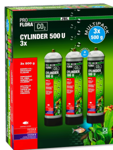
JBL PROFLORA CO2 CYLINDER 500 U 3x Bouteille de CO2 à usage unique, 500 g (pack de 3)