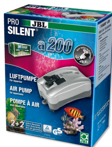
JBL PROSILENT a200 Luftpumpe für Süß- und Meerwasser-Aquarien