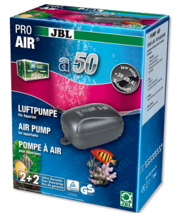
JBL PROAIR a50 Luftpumpe für Aquarien