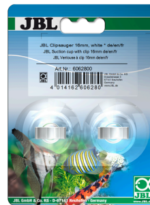
JBL Clipsauger 16 mm Gummisauger für Objekte von 16 mm Durchmesser