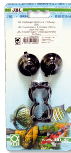
JBL Clipsauger 23 mm Gummisauger für Objekte von 23-28 mm Durchmesser