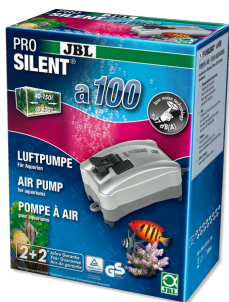
JBL PROSILENT a100 Luftpumpe für Süß- und Meerwasser-Aquarien