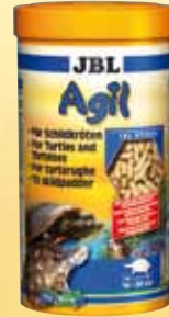
JBL Agil Sticks voor schildpadden