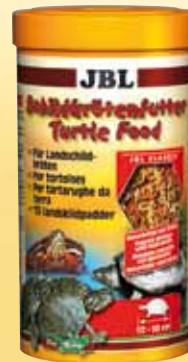
JBL Schildpadvoer Hoofdvoer voor alle moe- ras-/waterschildpadden