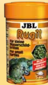
JBL Rugil Sticks voor kleine moeras-/water- schildpadden