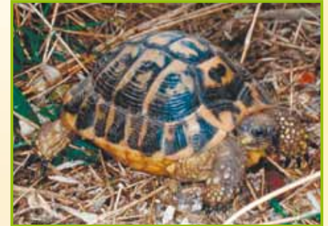
Testudo hermanni hermanni