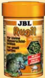
JBL Rugil Sticks voor kleine moeras-/ water- schildpadden