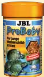
JBL ProBaby Speciaal voer voor jonge water- schildpadden