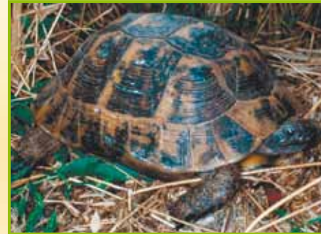
Testudo graeca iberia