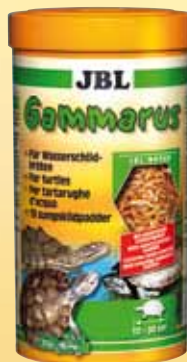
JBL Gammarus Gezuiverde zoetwaterkreeftjes, hoofdvoer voor alle moeras-/ waterschildpadden