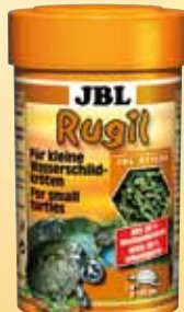
JBL Rugil Sticks voor kleine moeras-/waterschildpadden