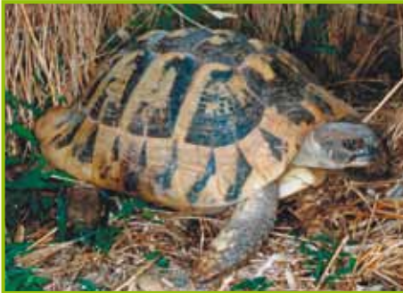
Testudo hermanni boettgeri