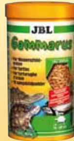
JBL Gammarus Gezuiverde zoetwater- kreeftjes, hoofdvoer voor alle waterschild- padden