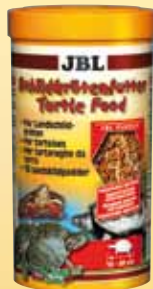
JBL Schild- padvoer Hoofdvoer voor alle waterschild- padden