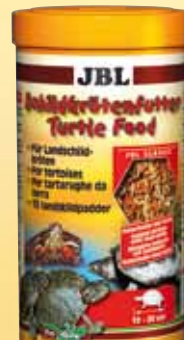
JBL Schildpadvoer Hoofdvoer voor alle moeras-/waterschildpadden