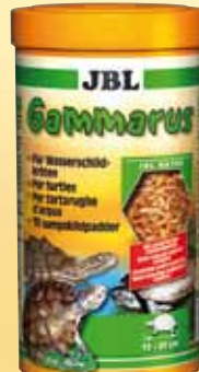
JBL Gammarus Gezuiverde zoetwaterkreeftjes, hoofdvoer voor alle moeras-/waterschildpadden