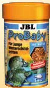
JBL ProBaby Speciaal voer voor jonge moeras-/waterschildpadden