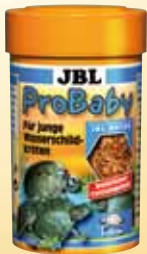
JBL ProBaby Spezialfutter für junge Wasserschild- kröten