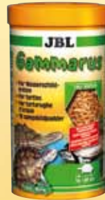
JBL Gammarus Gereinigte Bachfloh- krebse, Hauptfutter für alle Wasserschildkröten