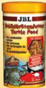
JBL Schild- krötenfutter Hauptnahrung für alle Wasser- schildkröten