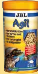
JBL Agil Futtersticks für Schildkröten