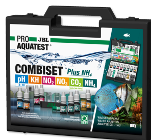
JBL PROAQUATEST COMBISET Plus NH 4 Testkoffer mit den wichtigsten Wassertests + NH 4 -Test