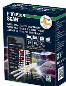
JBL PROSCAN Test de l'eau avec analyse sur smartphone