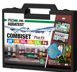
JBL PROAQUATEST COMBISET Plus Fe Coffret avec les principaux tests d'eau + test fer