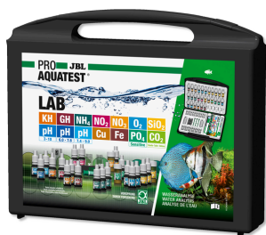
JBL PROAQUATEST LAB Valigetta con 13 test per l'analisi dell'acqua dolce