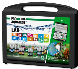
JBL PROAQUATEST LAB Coffret de 13 tests pour analyse de l'eau douce