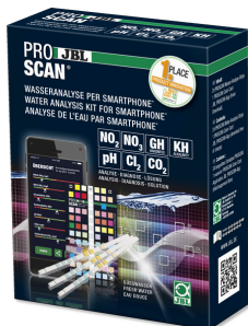
JBL PROSCAN Test de l'eau avec analyse sur smartphone