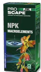
JBL PROSCAPE NPK MACROELEMENTS Engrais végétal à 3 composants pour aquascaping