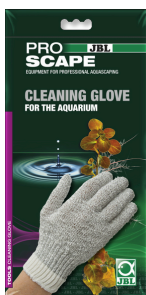
JBL PROSCAPE CLEANING GLOVE Gant de nettoyage pour aquarium