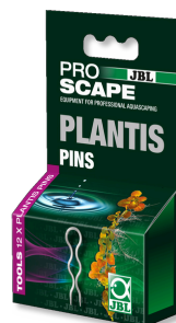
ÉPINGLES JBL PROSCAPE PLANTIS Épingles pour fixation des plantes en aquarium