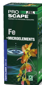
JBL PROSCAPE Fe + MICROELEMENTS Engrais végétal de base pour aquascaping