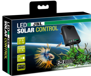
JBL LED SOLAR CONTROL

Appareil de commande pour lampes JBL LED SOLAR