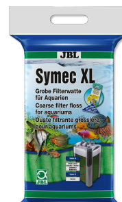
JBL Symec XL Ouate filtrante grossière contre la turbidité de l'eau