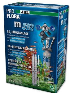
JBL PROFLORA m502 Aquariumpflanzen-CO2 Düngeranlage mit Nachtabschaltung