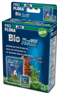
JBL PROFLORA BioRefill Nachfüllset für Bio- CO2- Düngeanlagen