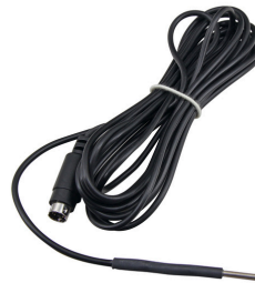
JBL pH-Control, sonde de température