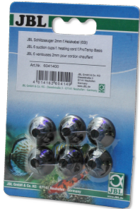
Ventouses JBL fendues 2 mm

Fixation de cordon chauffant en aquarium ou terrarium