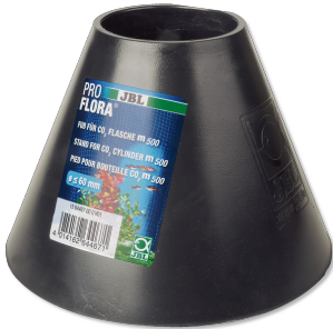
JBL PROFLORA supporto per bomboletta CO2 da 500 g

Base per bombole di impianti di fertilizzazione CO2