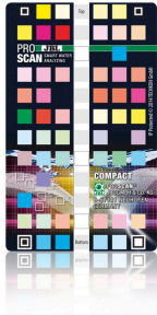
JBL PROSCAN ColorCard