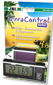
JBL TerraControl Solar Termometro e igrometro solari per tutti i terrari