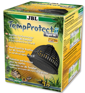
JBL TempProtect II light Protezione ustioni per rettili, per JBL TempSets