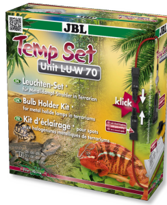
JBL TempSet Unit L-U- W Kit d'installazione per i faretto LUW e HQI