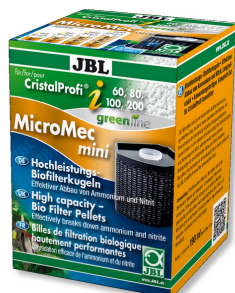
JBL MicroMec CristalProfi i60/80/100/200 Sfere filtranti ad alto rendimento per CristalProfi i