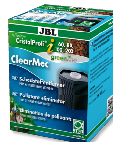
JBL ClearMec CristalProfi i60/80/100/200 Rimovete di nitriti, nitriti e fosfati per CPI