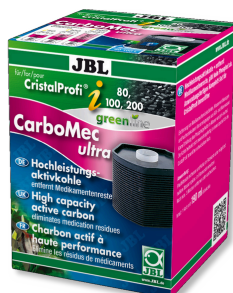
JBL CarboMec ultra CristalProfi i60/80/100/200 Inserto filtro con carbone attivo per CristalProfi i