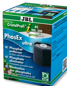
JBL PhosEx Ultra CristalProfi i60/80/100/200 Cartuccia antifosfati per CristalProfi i