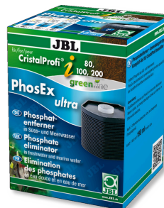
JBL PhosEx Ultra CristalProfi i60/80/100/200 Cartouche de produit antiphosphate pour CristalProfi