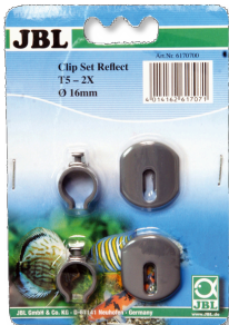
JBL SOLAR REFLECT Clip Set Halterung für Leuchtstoffröhren