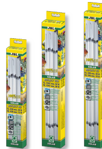
JBL SOLAR Reflect T5/ T8 - 895-1500 mm Reflektorblech für Solar- Leuchtstoffröhre