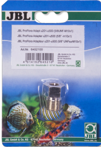
JBL PROFLORA Adapt u201-u500 Adaptateur pour détendeur u201