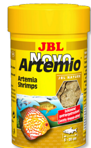
JBL NovoArtemio Complément d'artémias pour tous poissons d'aquarium