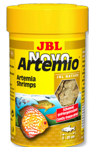
JBL NovoArtemio Artemia-Ergänzungsfutter für alle Aquarienfische