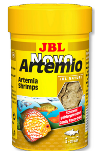
JBL NovoArtemio Mangime complementare per tutti i pesci d'acquario