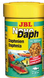
JBL NovoDaph Pulci d'acqua, una leccornia per i pesci d'acquario