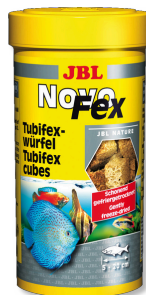
JBL NovoFex Cubetti tubifex, leccornia per i pesci d'acquario