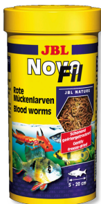
JBL NovoFil Larve di zanzare rosse per pesci d'acquario sfiziosi