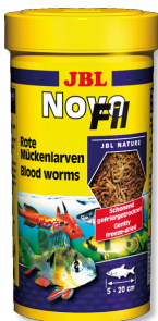
JBL NovoFil Rote Mückenlarven für wahlrische Aquarienfische