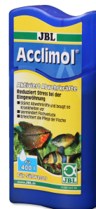
JBL Acclimol Preparazione dell'acqua per un nuovo ambientamento