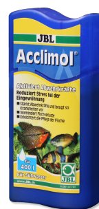
JBL Acclimol Conditionneur d'eau pour l'acclimatation des poissons