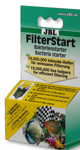
JBL FilterStart Batteri per l'attivazione del filtro