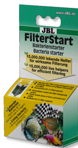
JBL FilterStart Bactéries pour activation des filtres