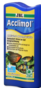
JBL Acclimol Preparazione dell'acqua per un nuovo ambientamento