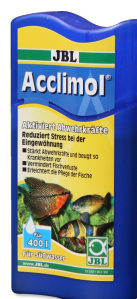
JBL Acclimol Preparazione dell'acqua per un nuovo ambientamento