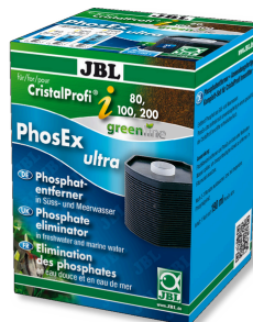
JBL PhosEx Ultra CristalProfi i60/80/100/200 Cartuccia antifosfati per CristalProfi i