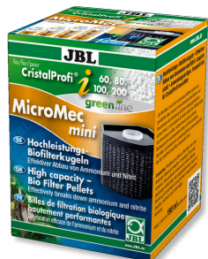
JBL MicroMec CristalProfi i60/80/100/200 Sfere filtranti ad alto rendimento per CristalProfi i