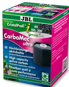
JBL CarboMec ultra CristalProfi i60/80/100/200 Inserto filtro con carbone attivo per CristalProfi i