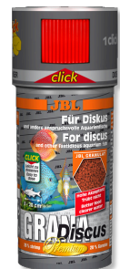
JBL GranaDiscus CLICK Premium-Hauptfuttergranulat mit Dosierer für Diskus