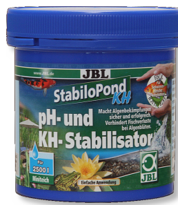
JBL StabiloPond KH Stabilizzatore pH per laghetti da giardino