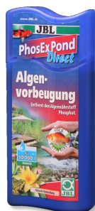
JBL PhosEx Pond Direct Rimovente di fosfati per laghetti