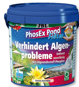
JBL PhosEX Pond Filter Rimovente di fosfati per i filtri da laghetto