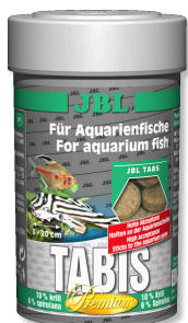
JBL Tabis Mangime Premium in comprese per tutti i pesci