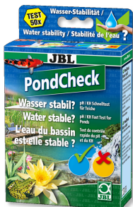
JBL PondCheck Schnelltest zur Bestimmung von pH- und KH-Wert