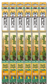
JBL SOLAR REPTIL JUNGLE T8

Tube T8 de terrarium pour animaux de forêts tropicales