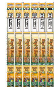
JBL SOLAR REPTIL SUN T8

Tube T8 de terrarium pour animaux des déserts