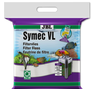
JBL Symec VL Vello d'ovatta contro tutti gli intorbidamenti