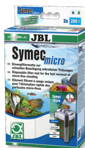
JBL Symec micro Microvello per filtri d'acquario contro intorbidamenti