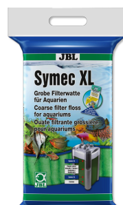
JBL Symec XL Ovatta filtrante grossa contro intorbidamenti