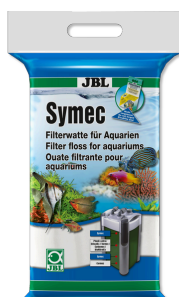
JBL Symec ovatta filtrante Ovatta filtrante contro tutti gli intorbidamenti