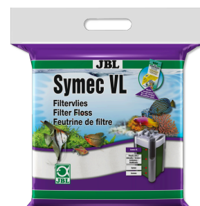
JBL Symec VL Vello d'ovatta contro tutti gli intorbidamenti