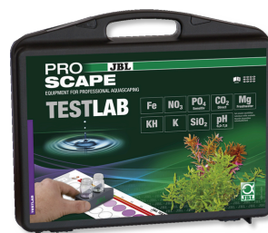
JBL Testlab ProScope Valigetta analisi dell'acqua in acquari con piante