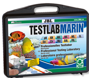
JBL Testlab Marin Valigetta professionale per analizzare l'acqua marina