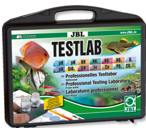
JBL Testlab Valigetta con 13 test per analisi acqua dolce. Testlab