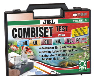
JBL Test Combi Set Pond I test più importanti per i laghetti da giardino