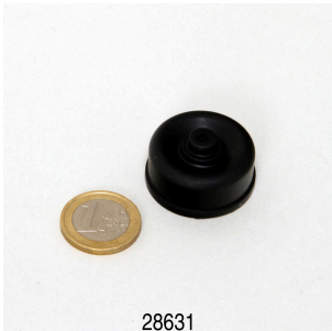
JBL PondOxi Set Membrane