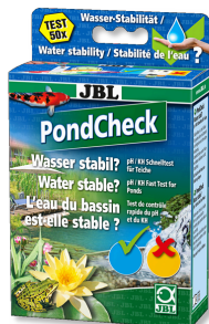
JBL PondCheck Schnelltest zur Bestimmung von pH- und KH-Wert