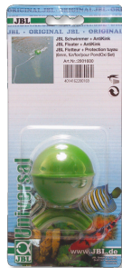
JBL Schwimmer+ Antikink Schwimmer mit Knickschutz für PondOxi-Set