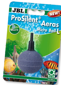
JBL ProSilent Aeras Micro Ball L Ausströmerstein für feine Luftblasen