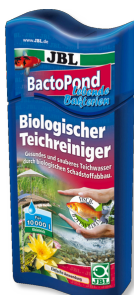
JBL BactoPond Batteri per l'autodepurazione del laghetto