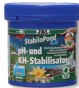
JBL StabiloPond KH Stabilizzatore pH per laghetti da giardino