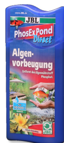
JBL PhosEx Pond Direct Rimovitore di fosfati per laghetti