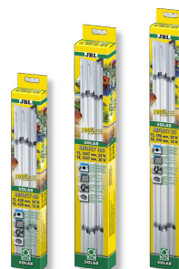
JBL SOLAR Reflect T5/ T8 - 895-1500 mm Pannello riflettore per tubo fluorescente Solar