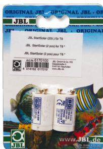
JBL StartSolar Starter per tubi fluorescenti T8