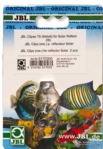
JBL Morsetti T5/T8 metallo Supporto di metallo per tubi fluorescenti