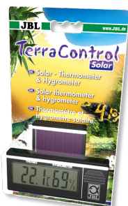
JBL TerraControl Solar Termometro e igrometro solari per tutti i terrari